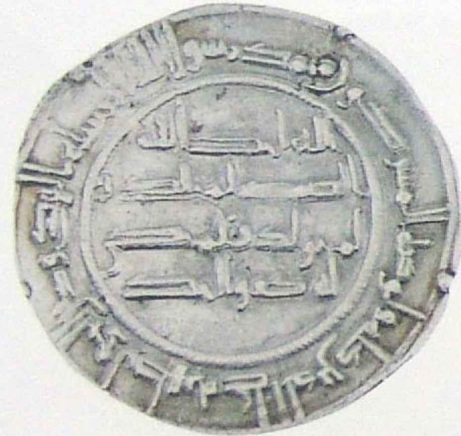
درهم أموي أندلسي عبد الرحمن الأول ضرب: الأندلس سنة: ١٥٤ هجري